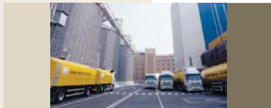
PORTO MARGHERA (Venezia)